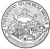
Università degli Studi di Brescia DICATA